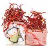
POLPO TUNA (8pz) 🍷

Polpo cotto a vapore, iceberg, cetriolo, carpaccio di tonno scottato esterno, patata julienne frita e salsa teriyaki