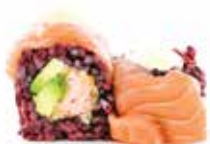
BLACK DOUBLE SALMON (8pz) 🍷

Salmon in tempura, avocado, philadelphia, maionese, carpaccio di salmone esterno e maionese al wasabi