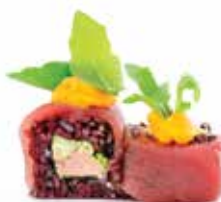
BLACK DOUBLE TUNA (8pz) 🍷 🌱

Salsa tonnata, cetriolo, iceberg, maionese, carpaccio di tonno esterno, purea di zucca, rucola e salsa teriyaki