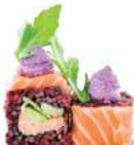
BLACK SALMON TUNA (8pz) 🍷

Salsa tonnata, cetriolo, iceberg, maionese, carpaccio di tonno esterno, purea di zucca, rucola e salsa teriyaki