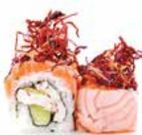
POLPO SALMON (8pz) 🍷

Polpo cotto a vapore, iceberg, cetriolo, carpaccio di tonno scottato esterno, patata julienne frita e salsa teriyaki