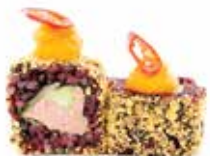
BLACK TORTILLAS (8pz) 🍷 🌱 🌶️

Salsa tonnata, cetriolo, iceberg, maionese, carpaccio di salmone esterno, purea di patata viola, rucola e salsa teriyaki