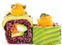
BLACK RICE PESTO (8pz) 🍷 🌱

Avocado, cetriolo, iceberg, carote, carpaccio di avocado esterno, purea di carote, pistacchio e pesto