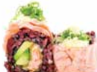
BLACK GRILL SALMON (8pz) 🍷

Salmon in tempura, avocado, philadelphia, maionese, carpaccio di salmone esterno e maionese al wasabi