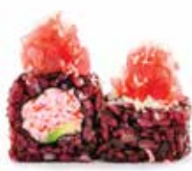
BLACK CRAB TUNA (8pz) 🍷

Polpa di granchio, maionese, tobiko, avocado, tartare di salmone esterna, crunch e salsa teriyaki