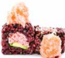
BLACK CRAB SALMON (8pz) 🍷

Polpa di granchio, maionese, tobiko, avocado, tartare di salmone esterna, crunch e salsa teriyaki