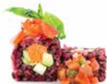
BLACK RICE BAXEIÇÒ (8pz) 🍷 🌱 🌿

Avocado, cetriolo, iceberg, carote, carpaccio di avocado esterno, purea di carote, pistacchio e pesto