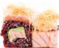
BLACK KATAIFI SALMON (8pz) 🍷

Salsa tonnata, cetriolo, iceberg, maionese, purea di carote, nachos, jalapeño e salsa teriyaki